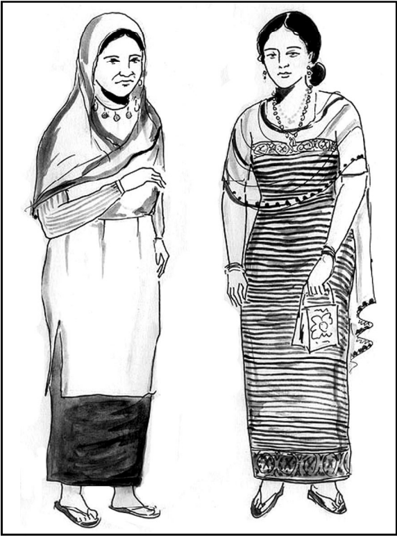
28. සූචිකර්ම: පුහුණුව